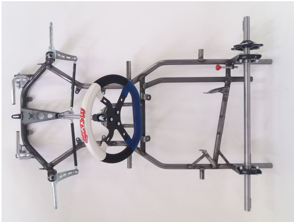
Photo du dessus du châssis complet identique à l'un des modèles présentés à l'homologation sans pare-chocs, freins, carrosserie, siège ni roues. / Photo from above of complete chassis identical to one of the models submitted for homologation without bumpers, brakes, bodywork, seat or wheels.

Signature et tampon de l'ASN / Signature and stamp of the ASN